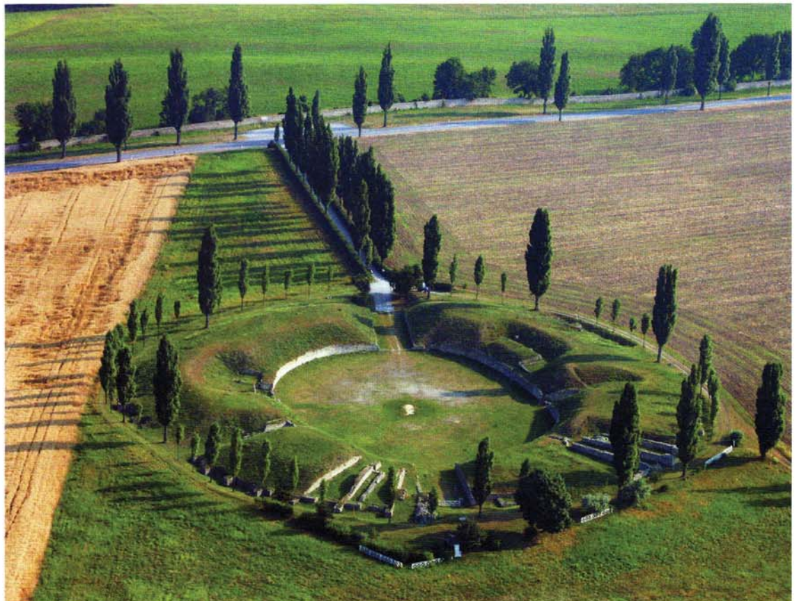
Gleich neben dem Amphitheater der Zivilstadt war unter der linken Ackerfläche von den Archäologen dank moderner Messmethoden die Gladiatorenschule entdeckt worden

Allerdings waren die Zweikämpfe mit Schwert, Dreizack und Netz keine Erfindung der Römer – sie