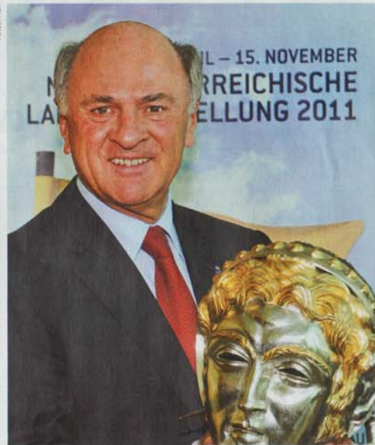
15. NOVEMBER REICHISCHE STELLUNG 2011