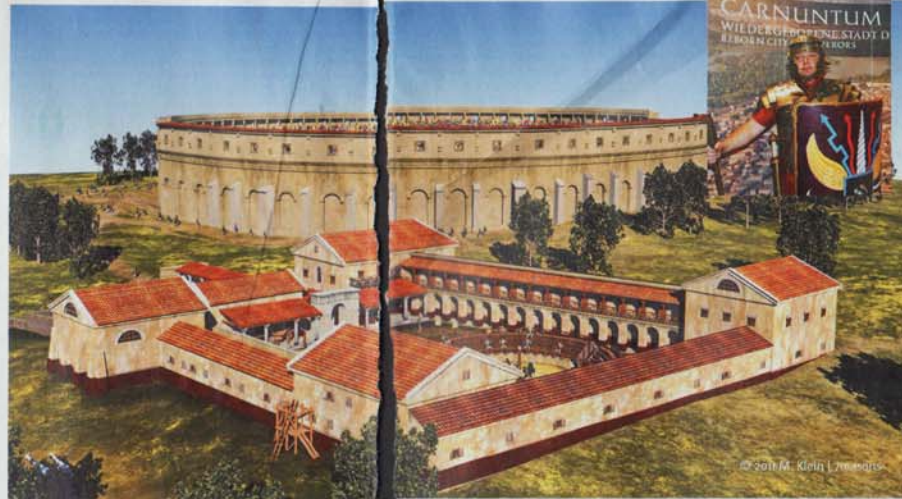
CARNUNTUM WILDERHÖRNERSTADT REBORN CITY - 1800 v. Chr.

Durch die Förderung der Erforschung von Österreichs größter archäologischer Landschaft setzt das Land Niederösterreich weltweit sowohl im wissenschaftlichen Bereich als auch im Präsentations- und Ver-